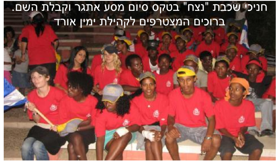
חניכי שכבת "נצח" בטקס סיום מסע אתגר וקבלת השם. ברוכים המצטרפים לקהילת ימין אורז